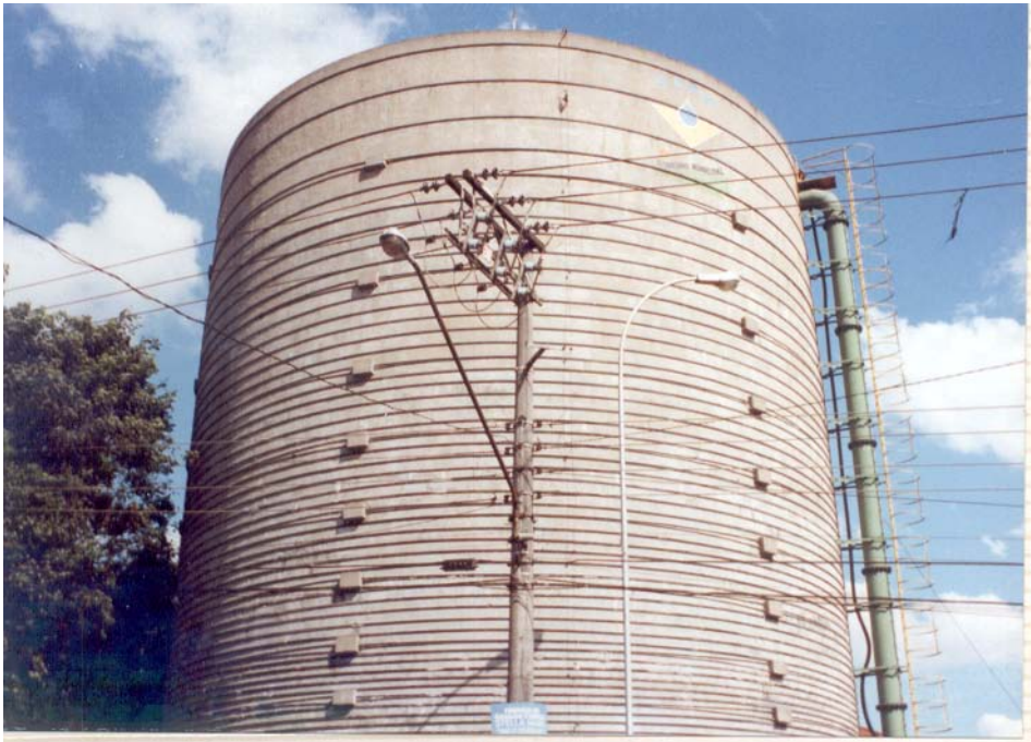
Foto do reservatório de concreto armado com 3000m 3 de capacidade de reservação de água com as cordoalhas de aço que pressurizam o reservatório.

Vi esta solução em um reservatório numa indústria de papel perto da futura barragem do Taiapuêba.