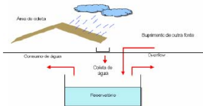
Figura 2- Esquema de aproveitamento de água de chuva

É a água coletada durante eventos de precipitação pluviométrica em telhados inclinados ou planos onde não haja passagem de veículos ou de pessoas. As águas de chuva que caem nos pisos residenciais, comerciais ou industriais não estão inclusas no sistema proposto.