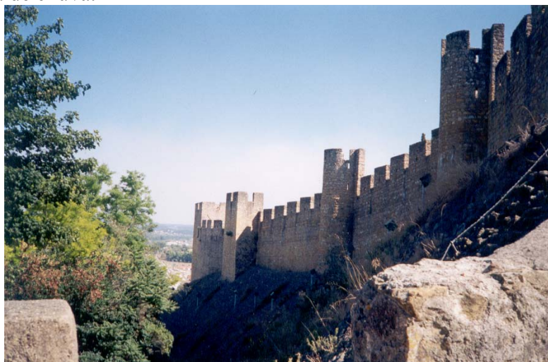
Figura 1- Fortaleza dos Templários; cidade de Tomar, Portugal, construída em 1160

A Fortaleza dos Templários localizada na cidade de Tomar em Portugal em 1160 dC, era abastecida com água de chuva.