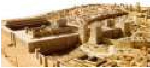
Maquete de Jerusalém antiga